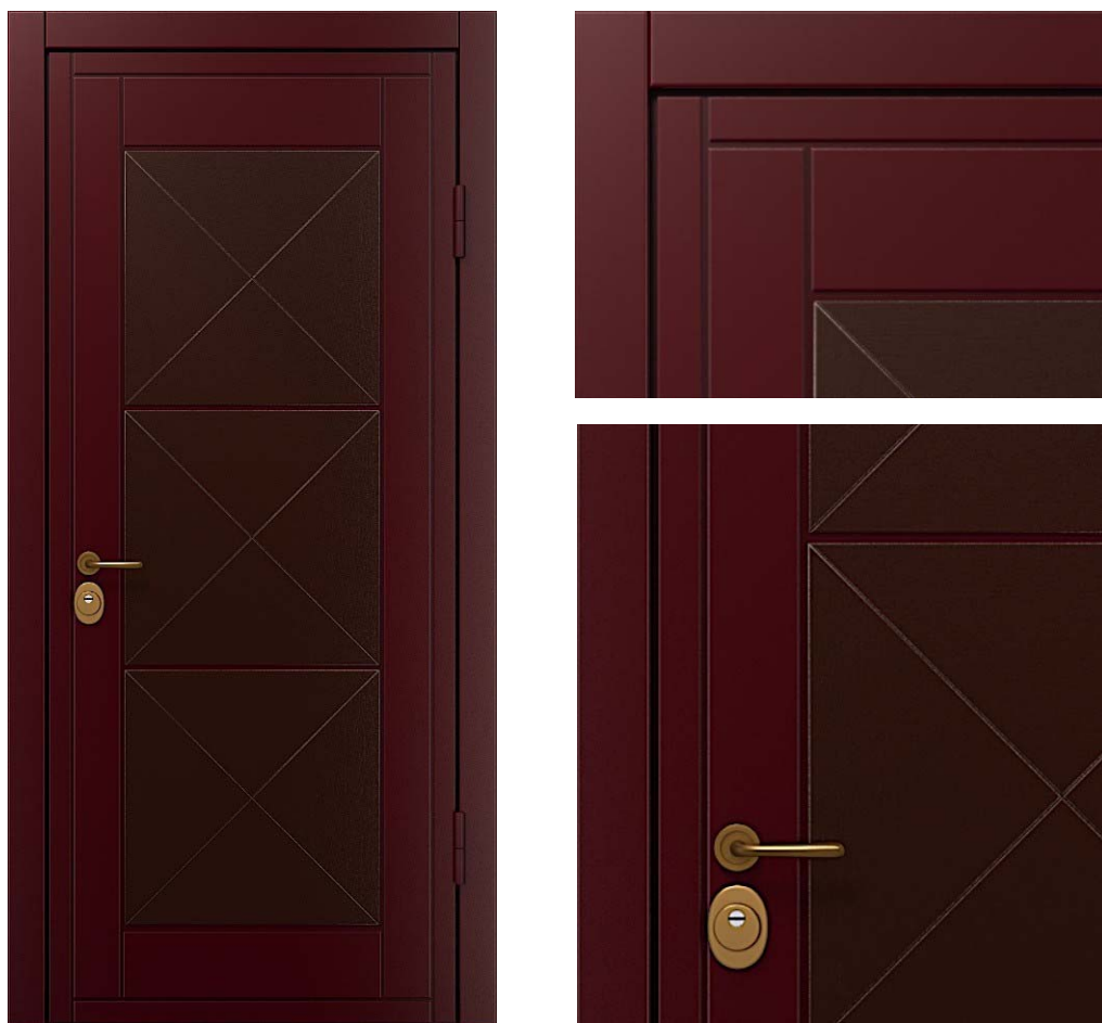
16 MINORA-E Дуб шоколадный WSD6M, окантовка MA15G Aubergine | Автолак MA15G&WSD6M

Высота двери 2100 мм. Ширина 900 мм. Дверь под проем 2115x930.