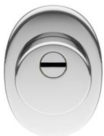
| 84515G800B | Mot-A2-Niz-Cyl