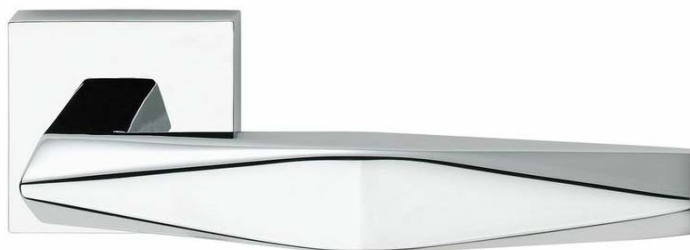
Ручка Prisma 1280 СТ хром

Дверь BARS EVO II Высота двери 2100 мм. Ширина 900 мм. Дверь под проем 2115x930.