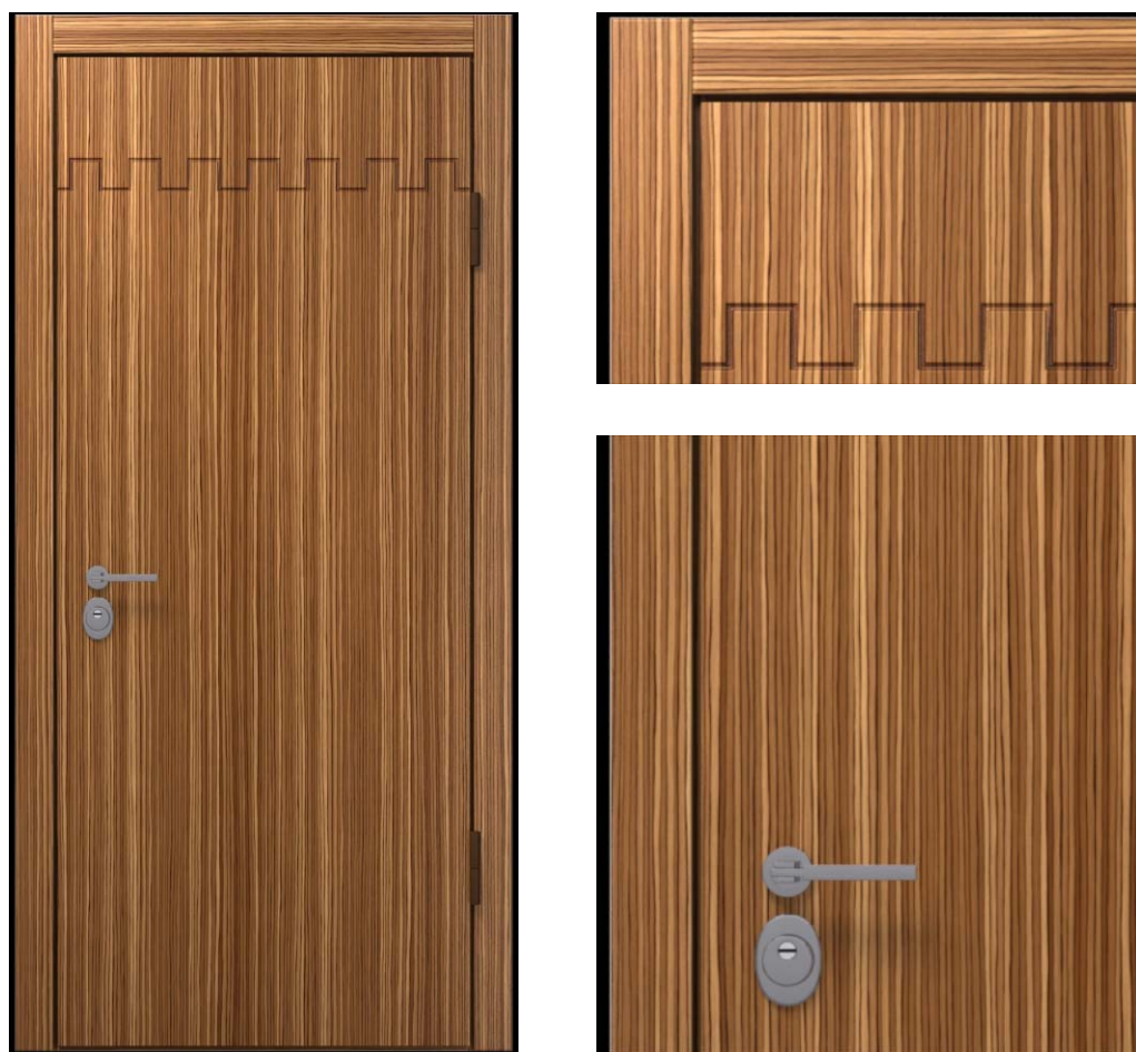
16 P-202 M-2 T Зебрано WF16M

Высота двери 2100 мм. Ширина 900 мм. Дверь под проем 2115x930.