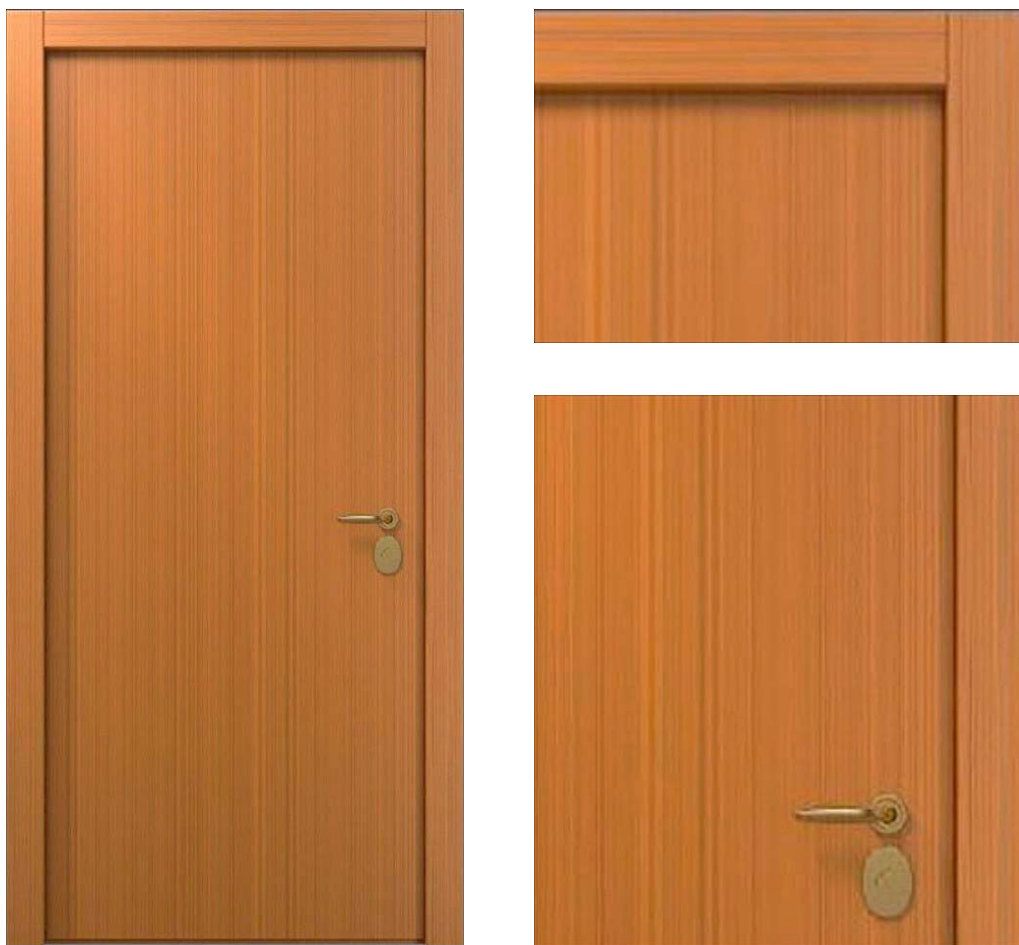
16 Вишня | Cherry L03

Высота двери 2100 мм. Ширина 900 мм. Дверь под проем 2115x930.