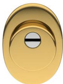
| 84515G800B | Mot-A2-Niz-Cyl